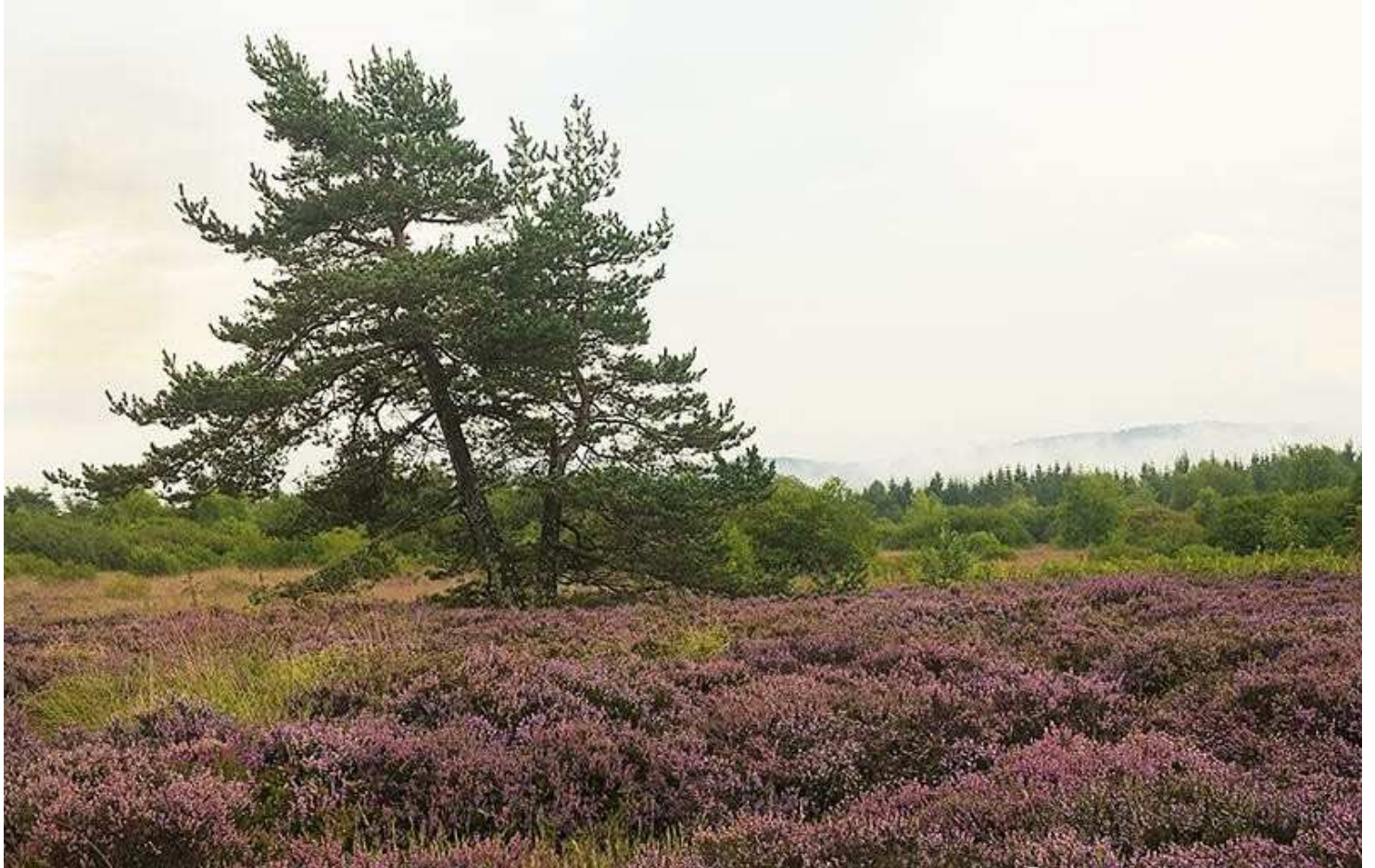
Landes - Montagne bourbonnaise (03)