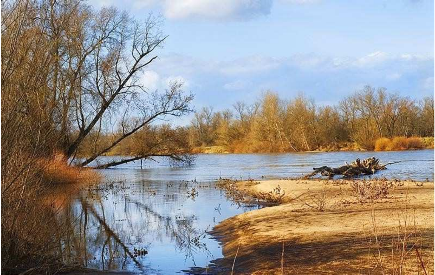
Rivière Allier - Commune de Montilly (03)